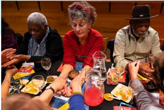
Keti Kot Tafel tijdens Sounds of Us