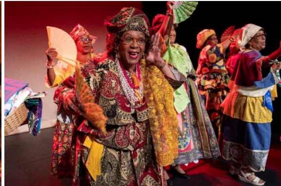
Afimo tijdens Sounds of Us