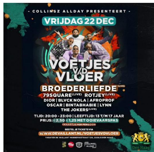
Instagram post Voetjes v/d Vloer

De urban werkplaats van De Vaillant bestond in 2023 net als De Vaillant 10 jaar en dat is gevierd. Met dank aan een Impulssubsidie van Gemeente Den Haag is na de zomer een traject opgestart waarbij jongeren zelf mee konden denken over aanvullende programma's als een Meet & Greet met artiesten, workshops etc. Grote motor daarbij was de toezegging van Broederliefde om aan deze programma's een bijdrage te leveren en tenslotte in De Vaillant een optreden te verzorgen.