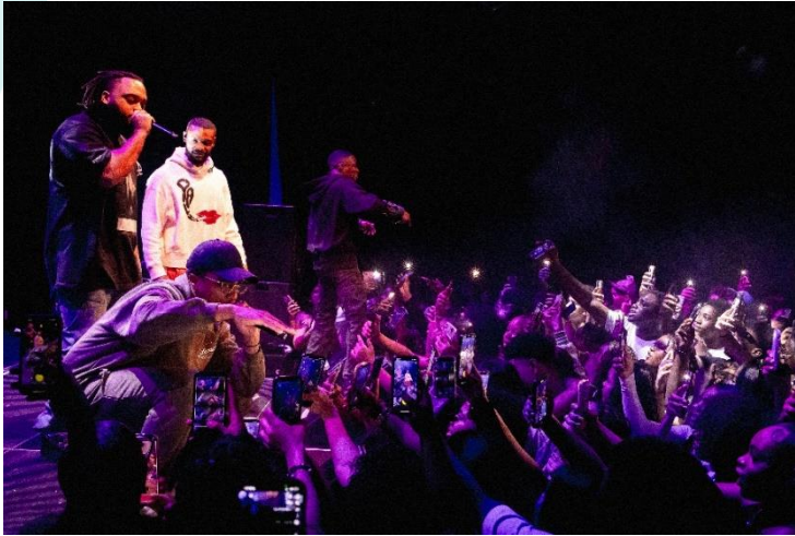
Broederliefde tijdens Voetjes v/d Vloer

maakte de komst van Broederliefde een hype. Met gemak hadden we 600 kaarten kunnen verkopen, mits ons huis groot genoeg was (zie visiestuk De Vaillant). Het was een topper die ons vooruit deed denken en resulteerde in een projectplan voor samenwerking met de Haagse rapper Frenna in 2024.