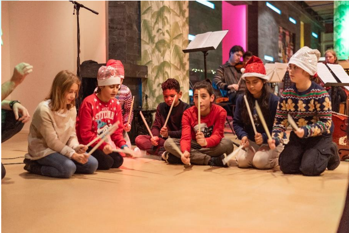
Kinderprogramma tijdens De Sociale Familie Tafel