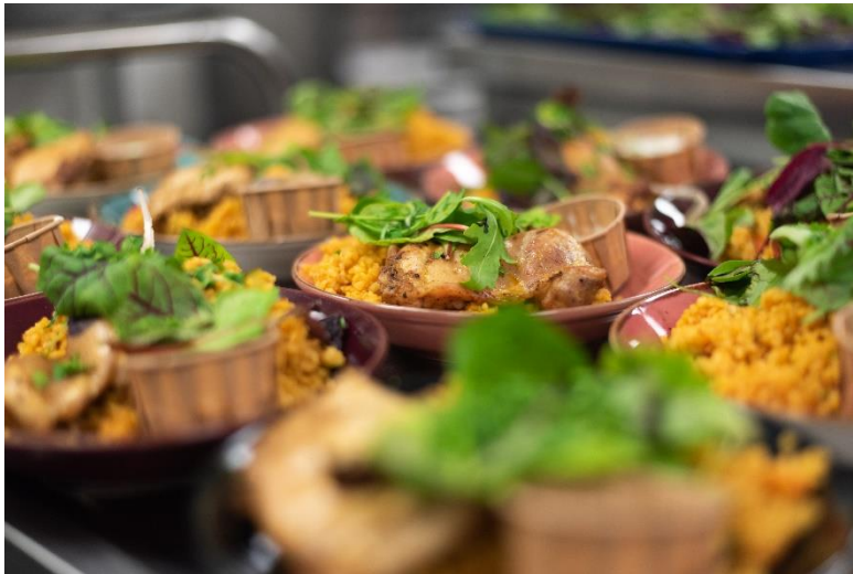
Eten tijdens De Sociale Familie Tafel

Zo is het voor De Vaillant ook mogelijk om de Sociale Tafels te realiseren en sluit de reguliere horeca rondom voorstellingen naadloos aan.