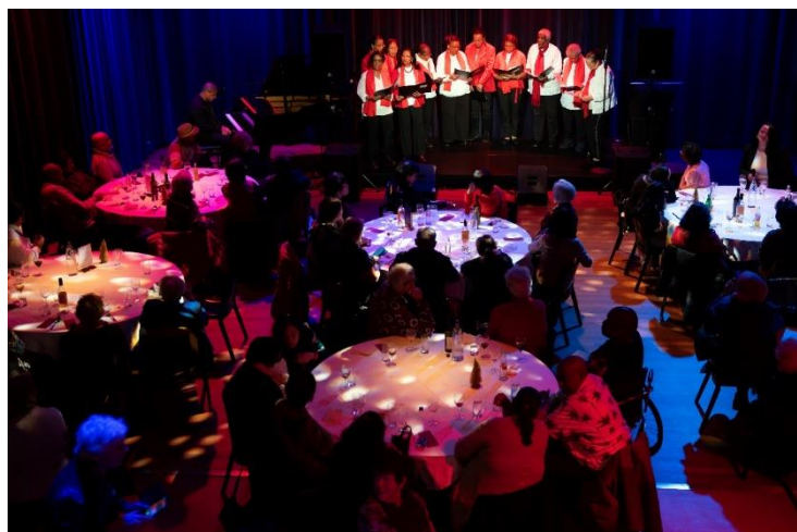
Kerst Diner De Sociale Tafel

De vraag vanuit verschillende groepen in de samenleving naar een smakelijke en betaalbare maaltijd groeit. De Vaillant speelde daar in 2023 op in met uitbreiding van de Sociale Tafels naar drie: wekelijks voor senioren, maandelijks voor mensen met een beperking en ook maandelijks voor gezinnen met een minimale beurs. Juist deze sociale tafels bieden De Vaillant de kans om mensen met cultuur in aanraking te brengen terwijl dat niet vanzelfsprekend lijkt.